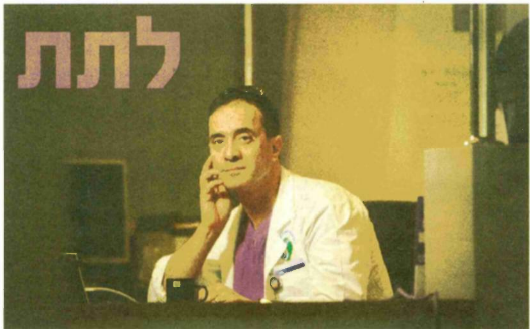
ד"ר בשירי עובד גם בשבת