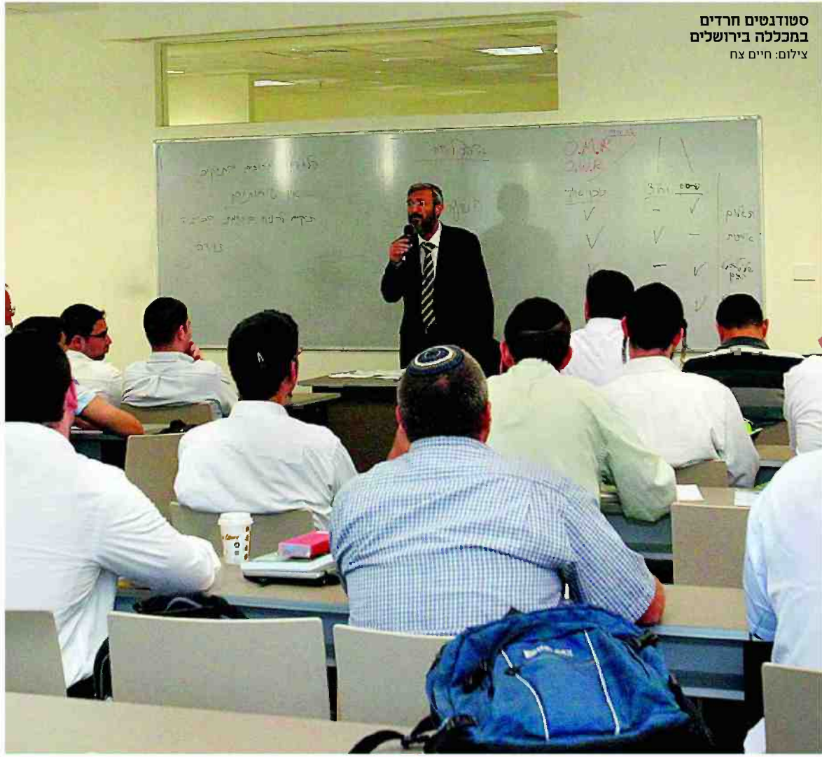
סטודנטים חרדים במכללה בירושלים