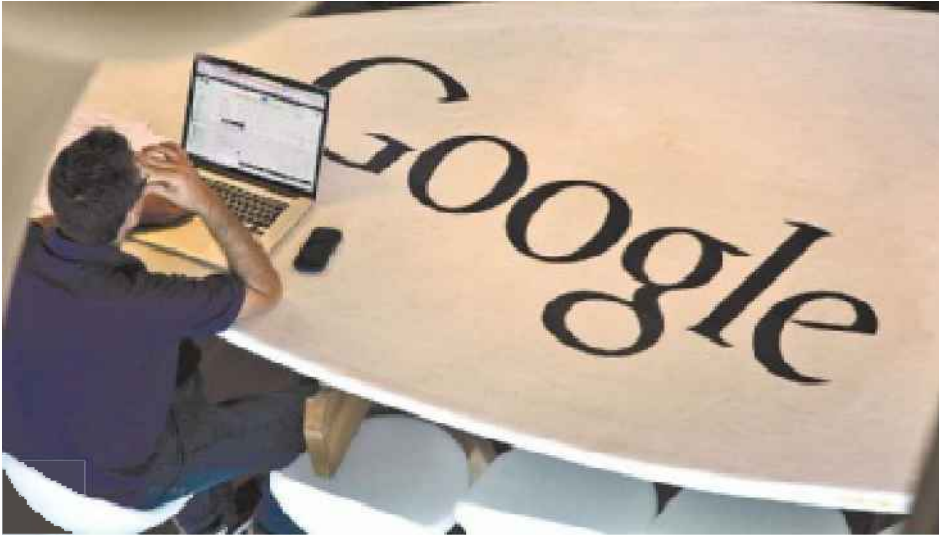
משרדי גוגל בישראל. "שיעור גדל והולך מהפנטים נרשם בחו"ל"