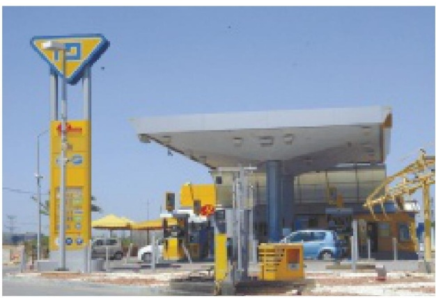
הצריכה של גז טבעי לתחבורה בישראל שואפת לאפס